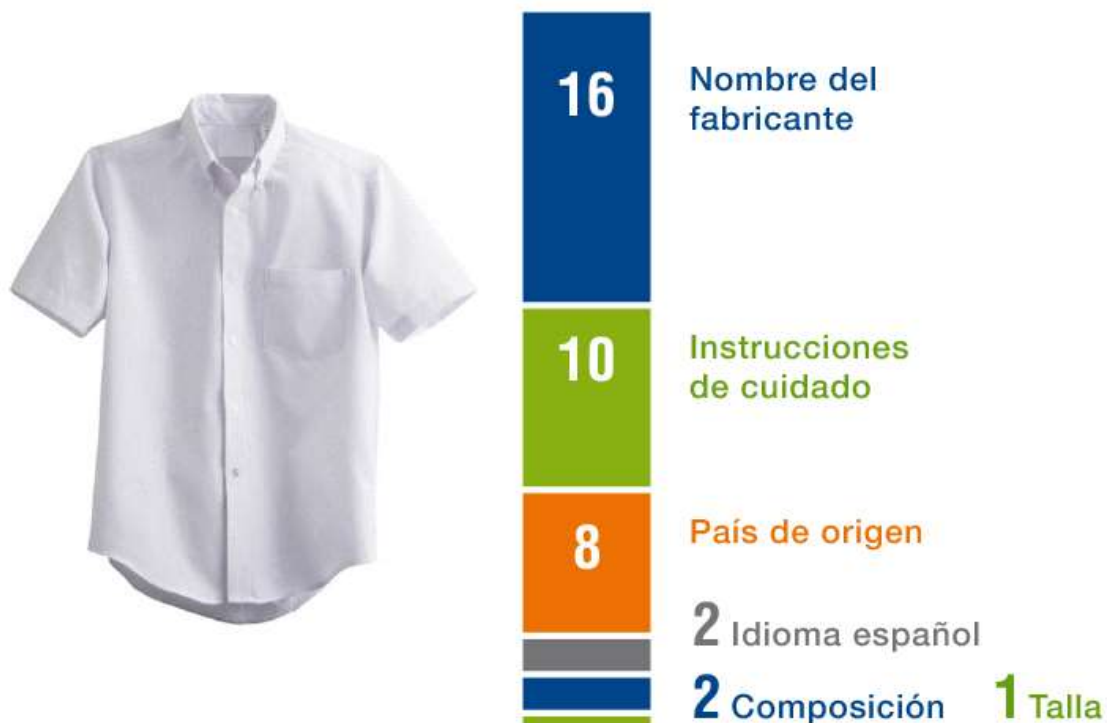
Gráfico N° 2 Incumplimiento en el etiquetado de prendas de vestir (uniformes)