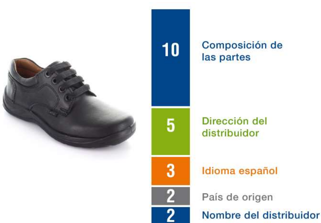
Gráfico N° 3 Incumplimientos encontrados en el etiquetado de calzado.